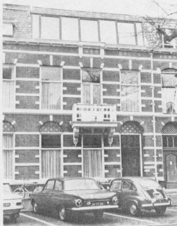
Jan van Nassaustraat 108 — den Haag, het onderkomen van Tandberg in Nederland. Administratie en service-afdeling plus een volledig ingerichte showroom.

Door tegenslag met de personeelsbezetting moest het roer na ruim een jaar worden omgegooid.