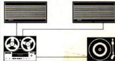
Tandberg Båndopptaker 2000 Stereo 2 stk. Tandberg høyttalere Hi-Fi 7 Platespiller