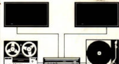
Tandberg Solvsuper 11 Stereo 2 stk. Tandberg høyttalere Hi-Fi 7 Tandberg Båndopptaker 2000 Stereo Platespiller