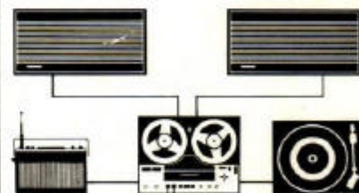
Tandberg Båndopptaker 2000 Stereo 2 stk. Tandberg høyttalere Hi-Fi 7 Tandberg Reiseradio TP 41 2 stk. Tandberg mikrofoner TM6 Platespiller